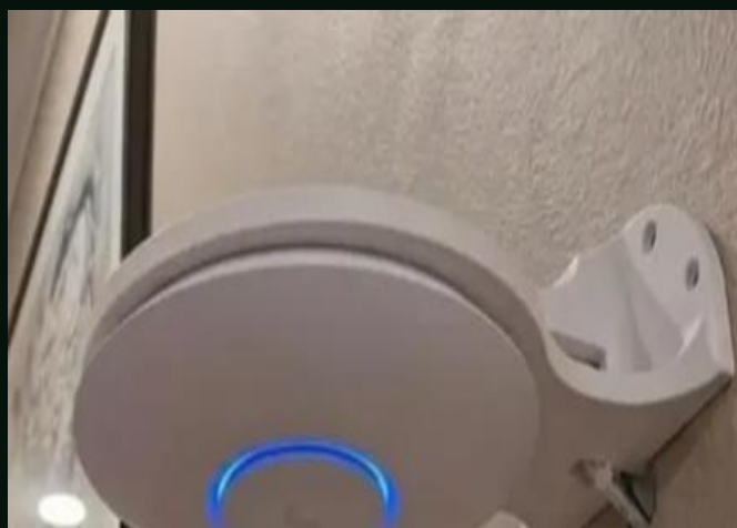
Access point instalado

Projetos com análise, infraestrutura protegida, organização e validação do sistema.