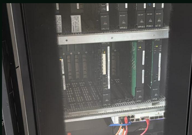
Central de gravação