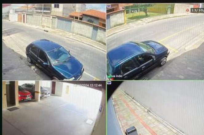
Sistema em operação