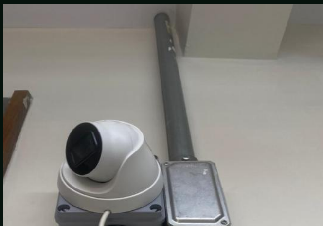
Câmera e infraestrutura protegida